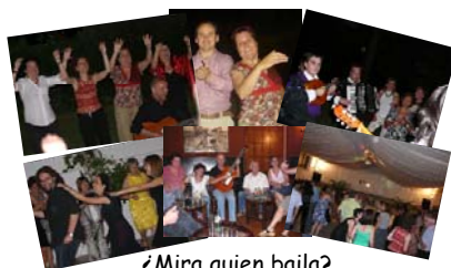
¿Mira quien baila?

"Mira quien baila" es un concurso televisivo con gran tradición en nuestros Simposios. ¡Pero que arte tienen los socios de la AEPECT!