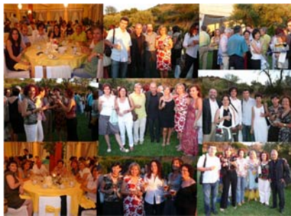
Detalles de diferentes momentos de la cena de gala (jueves, 10 de julio).