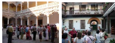
De turismo por Guadalajara y Alcalá de Henares

"Mira quien baila" es un concurso televisivo con gran tradición en nuestros Simposios. ¡Pero que arte tienen los socios de la AEPECT!