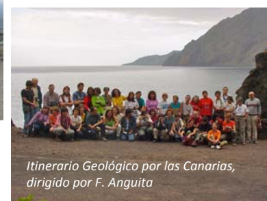
Itinerario Geológico por las Canarias, dirigido por F. Anguita