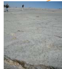
Huellas de dinosaurios en Sierra de los Aires (Portugal). VII Curso de Geología coordinado en la R.T. de Extremadura, en el 2009 bajo el título "Introducción a la Paleontología"