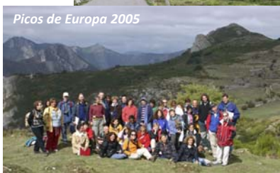
Picos de Europa 2005