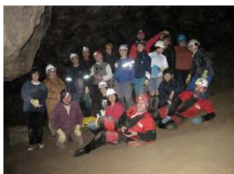
Karst de Villanúa visitado en el curso: "El karst como herramienta pedagógica" Organiza R.T. Aragón(2010)