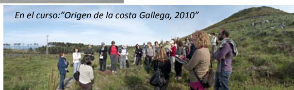
En el curso: "Origen de la costa Gallega, 2010"