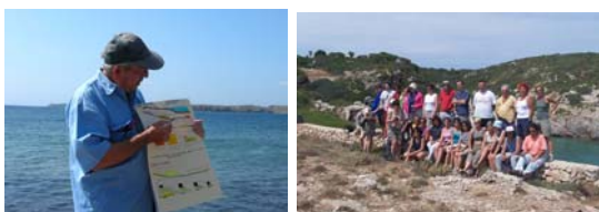
Haciendo un recorrido geológico en Menorca, coordinado por la R.T. de Baleares (2004)