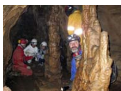
O Caurel 2009