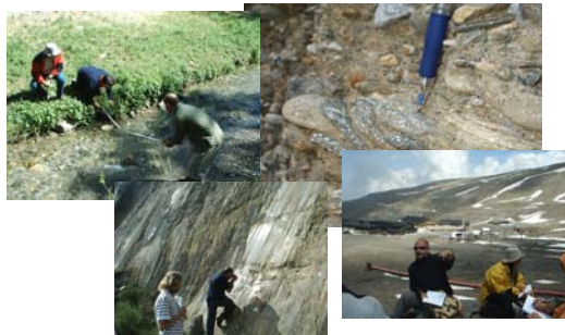
Estudiamos el Darro (2005) y Sierra Nevada (2006) coordinados en la R.T. Andalucía

Pero... la naturaleza es la principal protagonista