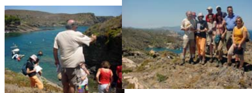
En el año 2004 se realizó coordinada por la R.T. de Cataluña una "Semana Geoturística Ampordá -Figures"