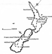
Plano del viaje