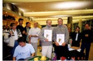
Aeropuerto de Oklam