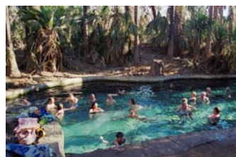
Sufridores aepecos soportando las inclemencias del duro viaje en la reserva de Mataranka