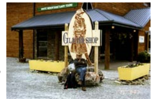
Un poco de descanso siempre es bienvenido