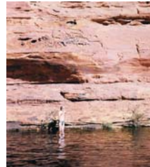
Aborigen aepectiano tomando un baño