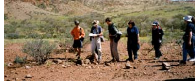
Grupo de aepecos en Australia