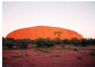
El Uluru, colores en abanico según la luz, subimos, nos hechizó....