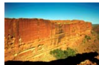
Kings Canyon, Wattarka