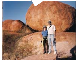
Las canicas del diablo