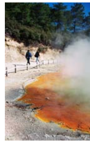
Whakarewarera thermal area rotorua